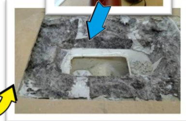
和風便器のリム面・ボール面をカット