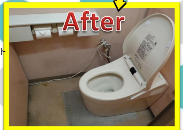
洋風便器とウォシュレットの取り付け