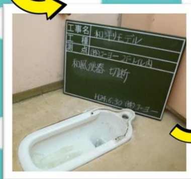
和風便器の前立て部をカット